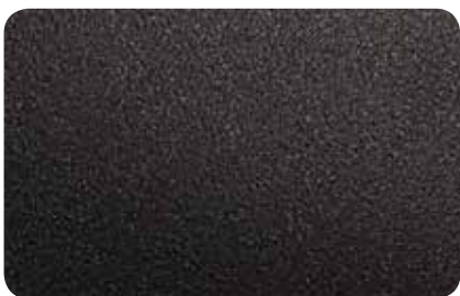
NOIR 200 SABLE