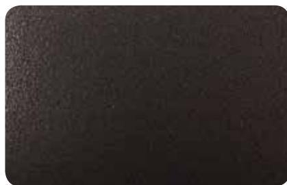
NEGRO CARBONO METALIZADO