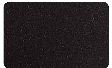
NEGRO FORJA TEXTURADO

> Il est possible de fournir toutes les couleurs du 'NUANCIER RAL' sur demande.